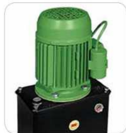
Centralita hidráulica MEC 700/80 VENTIL desde 2 L