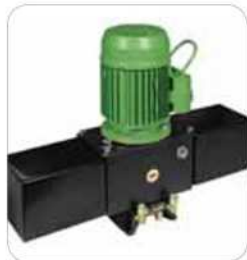
Centralita hidráulica MEC 700/80 VENTIL con doble depósito desde 4,5 l