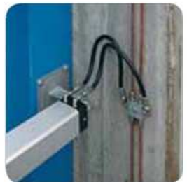
Conexión con el bloque de derivación con racores de 6 vías