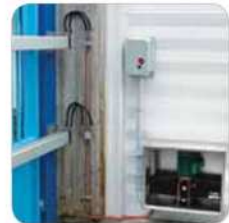
Centralita hidráulica MEC 700/80 VENTIL con doble depósito en el interior del armario de protección