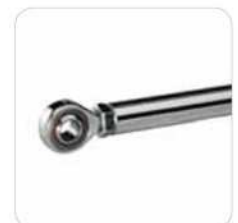
Ataque anterior con cabeza articulada ajustable

Nota: Versión sin bloqueo(reversible) es necesaria la electrocerradura.